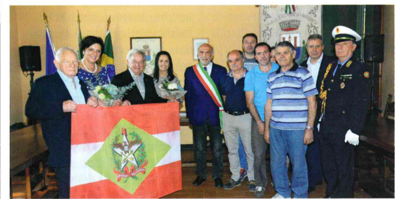
I fratelli Dognini con le mogli accolti in comune

discendenti dal bisnonno Gian Pietro, agricoltore casalese, accompagnati dalle mogli i due fratelli sono stati accolti in Comune che ha donato loro una copia del certificato di nascita del proprio avo.