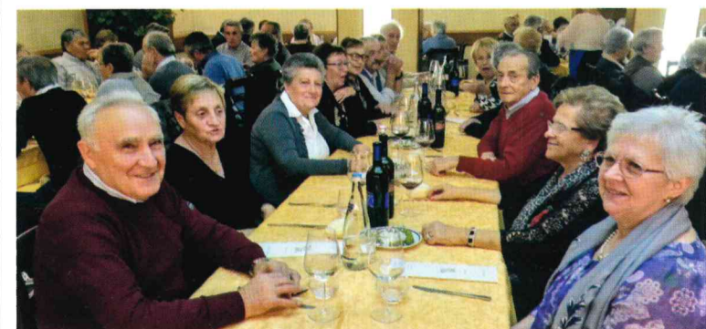
Un momento di una delle feste al ristorante

quisito: avere compiuto almeno 65 anni per parteciparvi. I primi due anni l'appuntamento si è svolto all'oratorio nei tre successivi in un ristorante di Sergnano: torta offerta da Galbani.