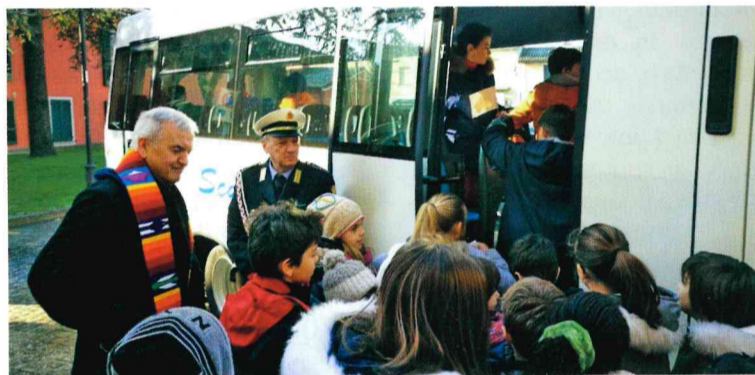
Inaugurazione nuovo scuolabus