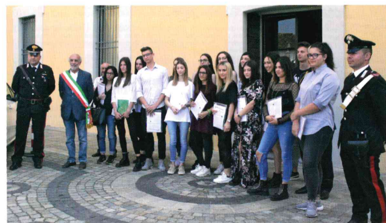
I diciottenni del 2018

O gni anno, per cinque anni, il 2 giugno in sala del consiglio è stata donata dal sindaco la Costituzione italiana ai diciottenni del Comune. La consegna avviene dopo la proiezione di un filmato storico del referendum del 2 giugno 1946 e della firma della Costituzione. Durante la cerimonia viene letto il famoso discorso sulla Costituzione tenuto da Piero Calamandrei agli studenti universitari di Milano il 26 gennaio 1955.