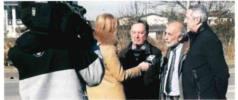
Le riprese del Tg1 che si è interessato al Centro

Dal 6 febbraio di quest'anno, grazie ad un accordo tra Casale, Pianengo e Sergnano ed una convenzione con Linea Gestione, il centro viene gestito da quest'ultima.