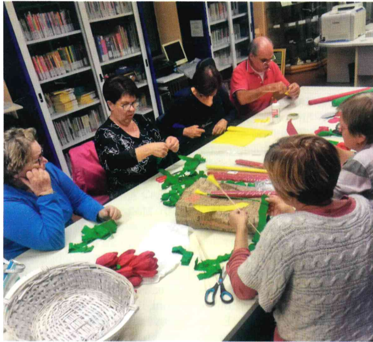
La consulta al lavoro per realizzare i tulipani rossi di carta

A partire dal 25 novembre 2014, ogni anno, l'Amministrazione, in collaborazione con la Consulta Pari Opportunità, ha voluto ricordare la giornata internazionale contro la violenza sulle donne insieme ad un'altra ricorrenza, l'8 marzo, giornata internazionale della donna . In queste due date, sono stati realizzati spettacoli con lettura di testimonianze e racconti al femminile, poesie di autrici di fama internazionale e locale, con l'accompagnamento di musiche dal vivo e interpretazioni canore. Le manifestazioni del 25 novembre hanno visto anche l'intervento di rappresentanti dell'Associazione Donne Contro la Violenza di Crema e la raccolta di fondi da devolvere a questa Associazione. In particolare nel 2016, l'Amministrazione ha sostenuto la campagna "Da che parte stai" lanciata dall'Associazione ARTEMISIA - Centro Anti-violenza di Firenze, con la distribuzione di fiori di panno rosso, realizzati a mano, da in-