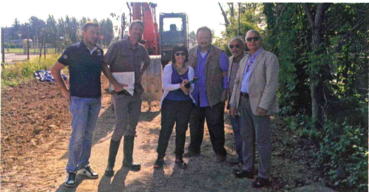
Il giorno dell'accordo tra comune e gli altri enti coinvolti

il comune l'intervento è stato di costo zero e si inserisce in un progetto più ampio di interventi che riguardano la roggia Babbiona. Il raccordo è stato inaugurato con una passeggiata naturalistica lungo il Serio.